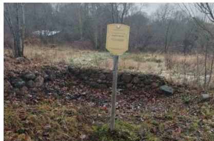
Рэшткі падмурка гаспадарчай пабудовы

У комплекс уваходзяць: сядзібны дом, кухня, вяндлярня, флігель, рэшткі падмурка гаспадарчай пабудовы. Панская сядзіба пабудавана на паўднёвай ускраіне в. Двор Нізгалава каля р. Ула ў стылі позняга класіцызму. Цэнтрам кампазіцыі з’яўляўся доўгі прамавугольны ў плане 1-павярховы мураваны будынак з вальмавым дахам. Галоўны фасад дома вылучаецца неглыбокім рызалітам з руставанымі вуглавымі лапаткамі, рэгулярным рытмам прамавугольных аконных праёмаў, дэкарыраваных прафіляванымі сандрыкамі на плоскіх кранштэйнах і надваконнымі шпішамі. У цэнтры дома размяшчалася парадная зала, якая выходзіла на плоскасны тыльны фасад трыма аконнымі прёмамі і была звязана з комнатамі доўгім калідорам. У пластыцы фасадаў выкарыставаны элементы класіцызма з характэрнай для 2-й пал. XIX ст. вольнай трактоўкай ордэра.