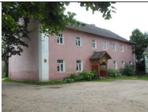
Гаспадарчая пабудова (былая кухня)