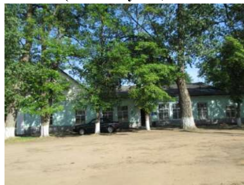
Гаспадарчая пабудова (былая канюшня для выездных коней)