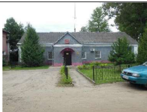
Гаспадарчая пабудова (былая пральня)