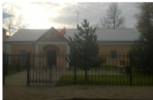
Гаспадарчая пабудова (былая пральня)