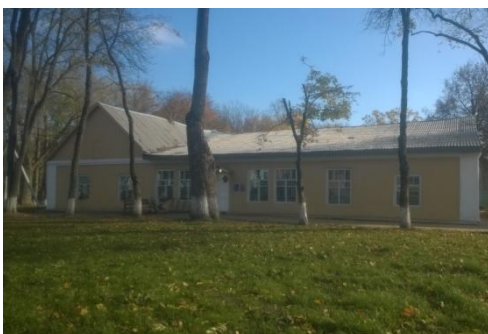
Гаспадарчая пабудова (былая канюшня для выездных коней)