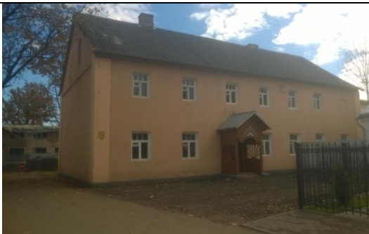
Гаспадарчая пабудова (былая кухня)