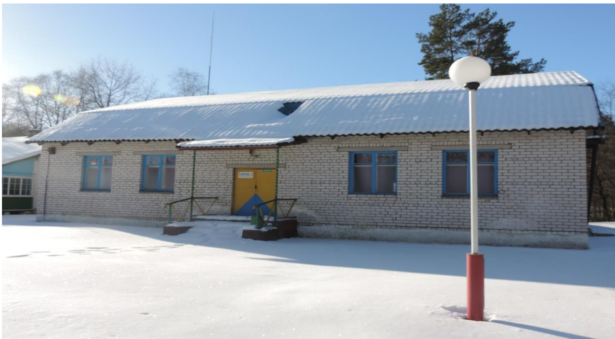
Здание специализированное физкультурно-оздоровительного и спортивного назначения, корпус № 3, 231/С-8952