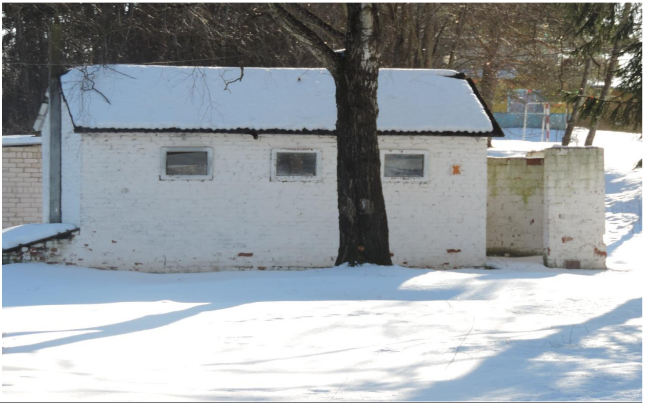
Здание специализированное автомобильного транспорта, Гараж, 231/С-8983