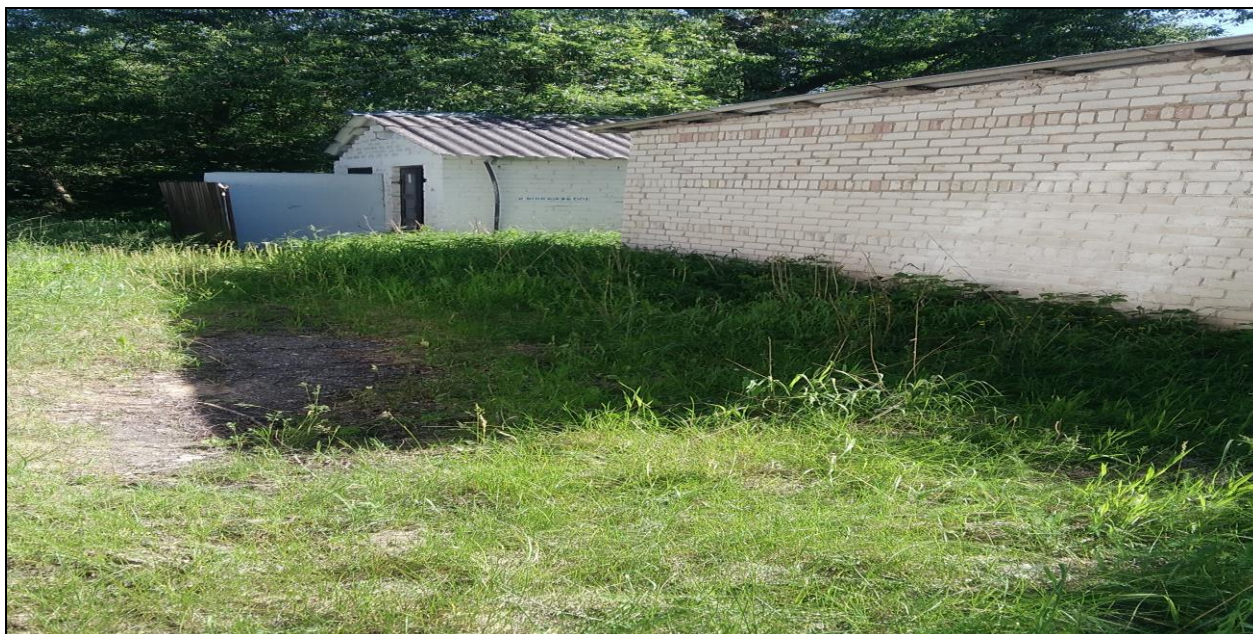
Здание неустановленного назначения, уборная, 231/С-8974