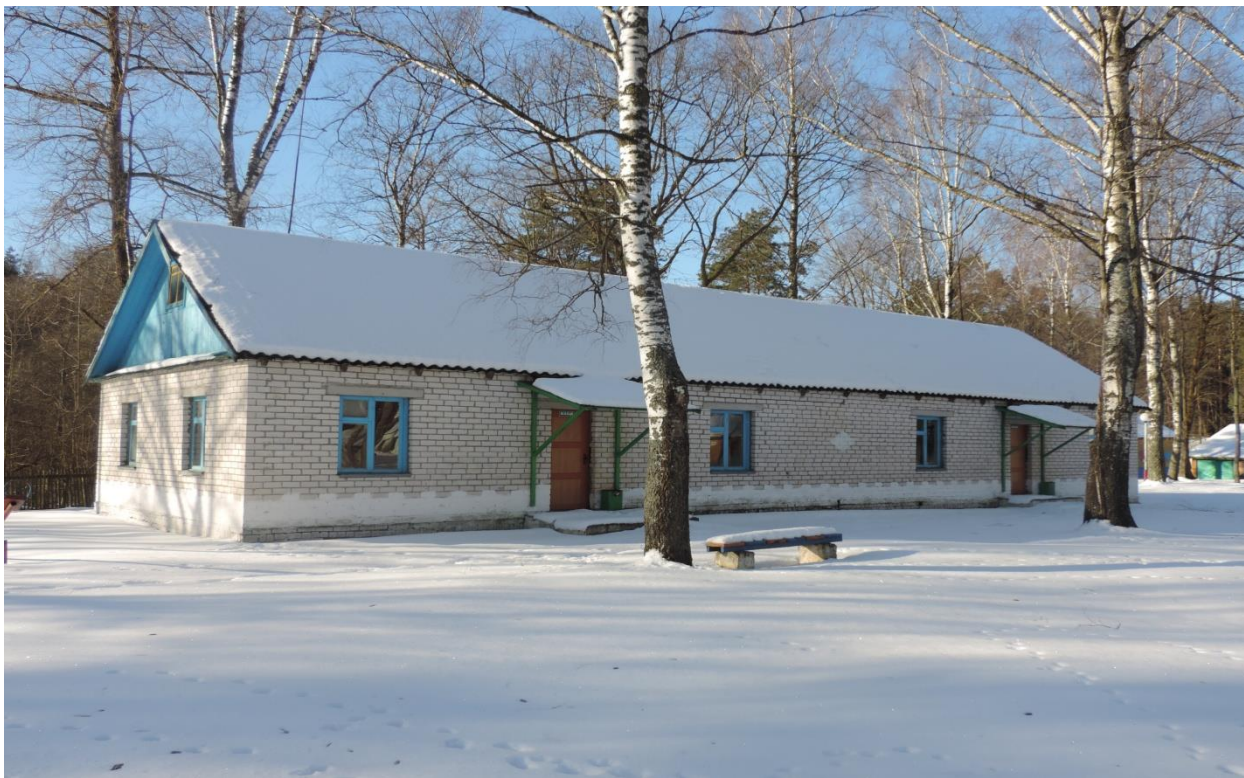
Здание специализированное физкультурно-оздоровительного и спортивного назначения, спальный корпус № 5, 231/С-8954