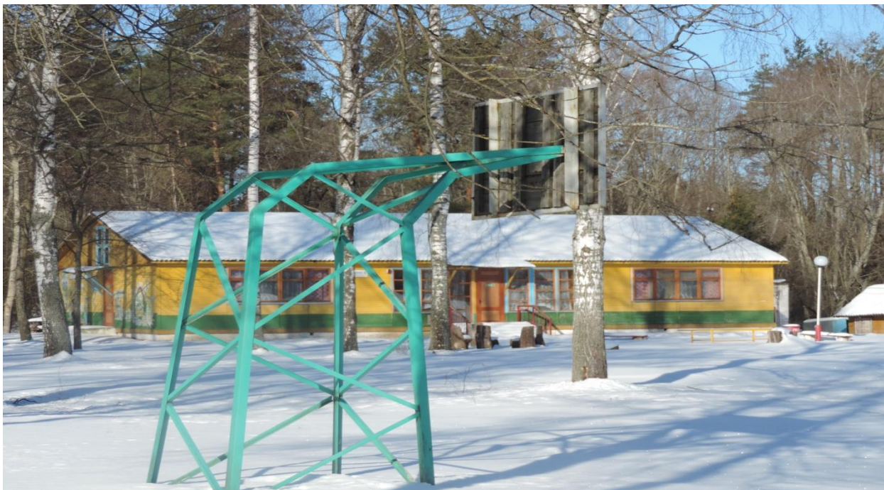
Здание специализированное физкультурно-оздоровительного и спортивного назначения, корпус № 7, 231/С-8956