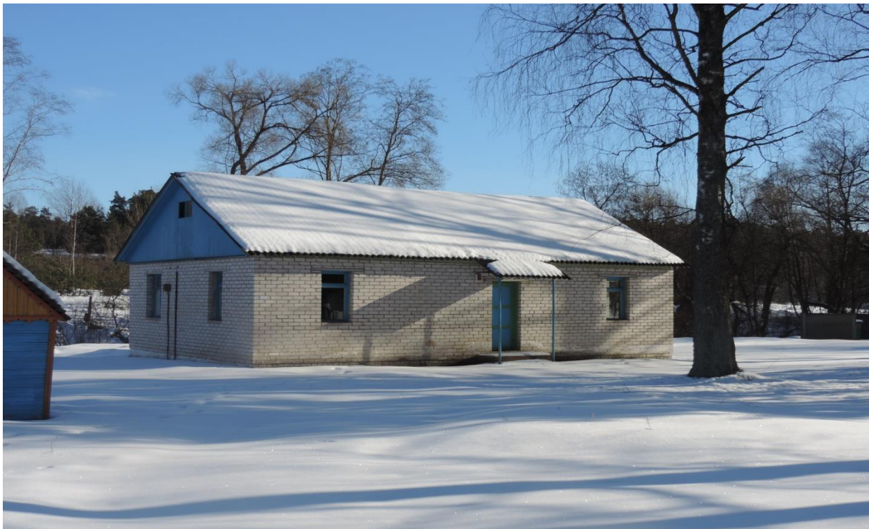
Здание специализированное физкультурно-оздоровительного и спортивного назначения, корпус № 9, 231/С-8958