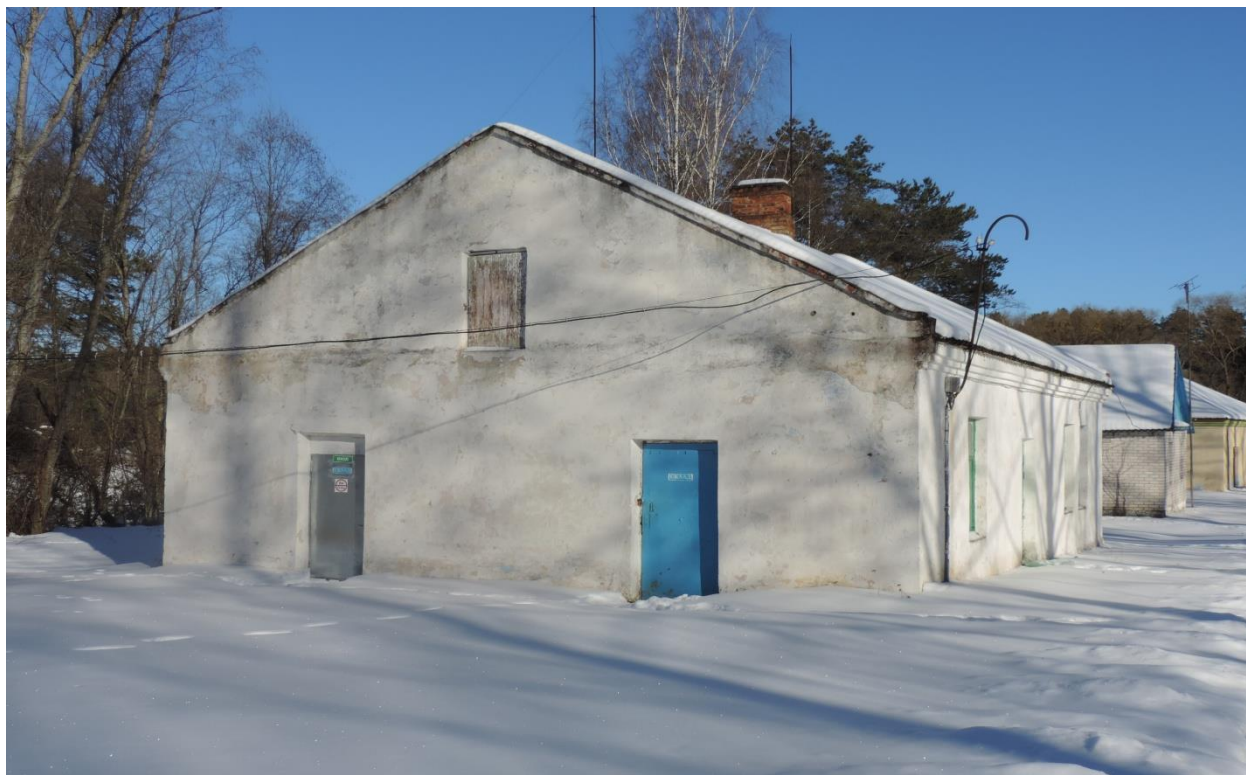
Здание неустановленного назначения, ДОМИК СТОРОЖА, 231/С-8973