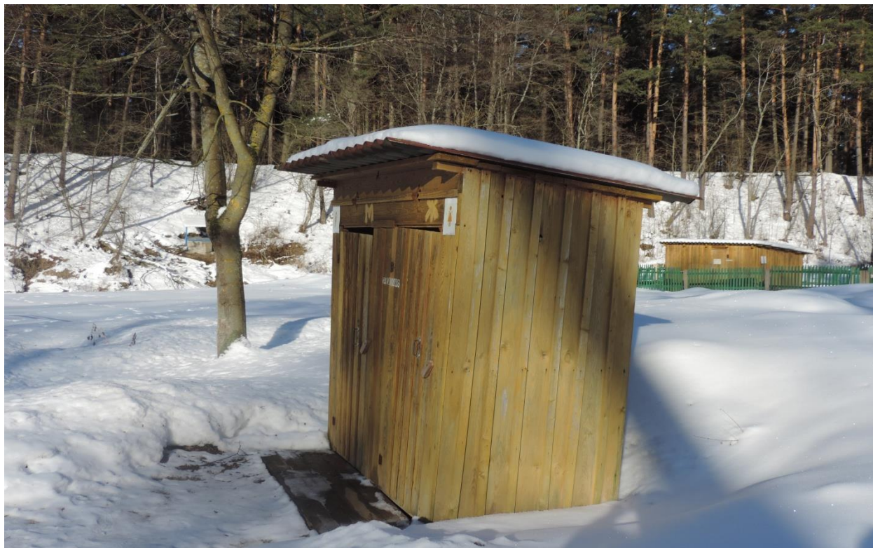
Здание неустановленного назначения, камера хранения, 231/С-8976