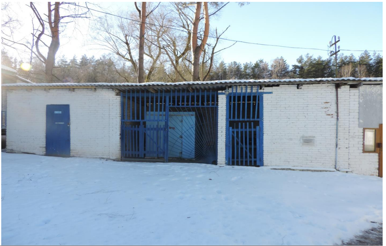
Здание неустановленного назначения, склад (кирпичный) с печками, 231/С-8971